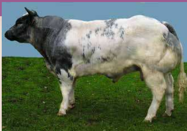
LORENC ZBM 223