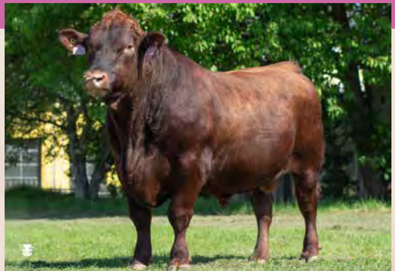
ERNEST RED ZAI 937