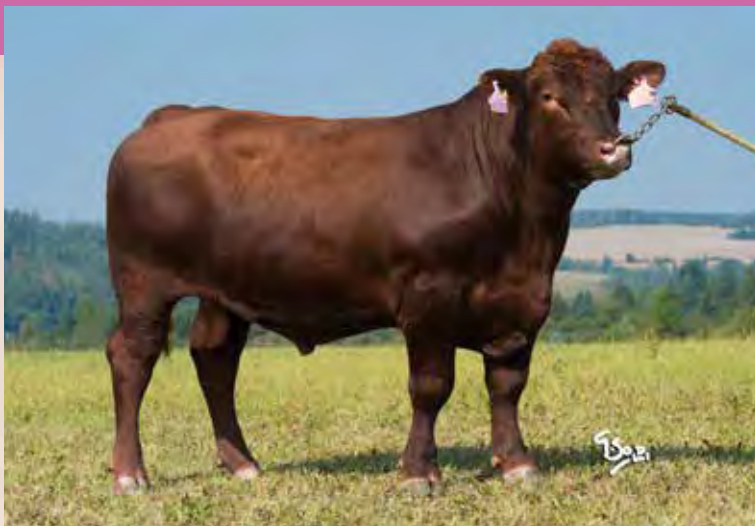
BOSTON RED ZAI 442

Americko-kanadský původ American-Canadian pedigree