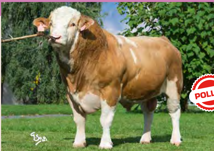
TUAREG PP ZSI 805

Lykke Sirius P ZSI 283 DK 4134400241 Dovefields Gallant x Lykke Opulus ET P Ouško Junior Agrochyt P CZ 193698961 Holm Ulrich P x Ouško Agrochyt P