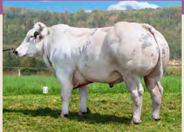
FERTIL ZBM 467