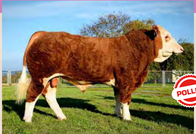
EPIK P ISI 401