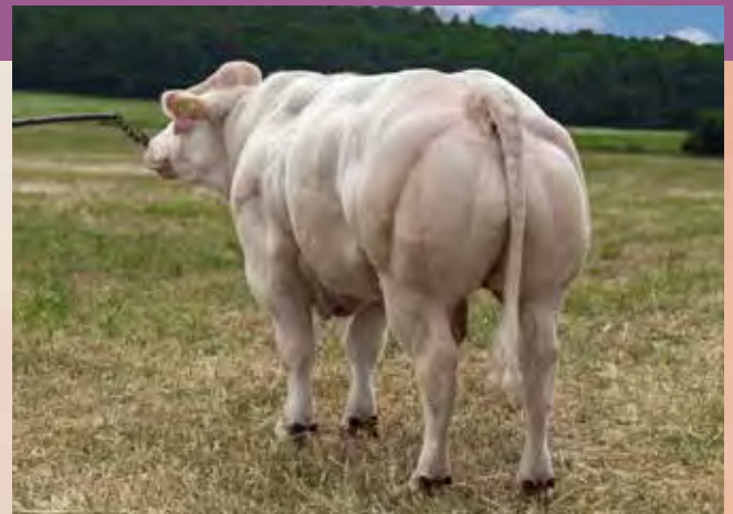
HARDWELL ZBM 465

Hojně využívaný do křížení Extensively used in crossbreeding