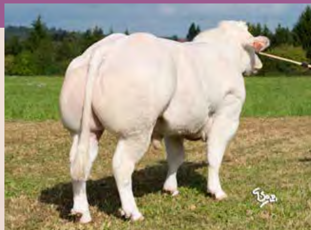
BORNEO ZBM 383

Porody / Calving: Na jalovice / For heifers