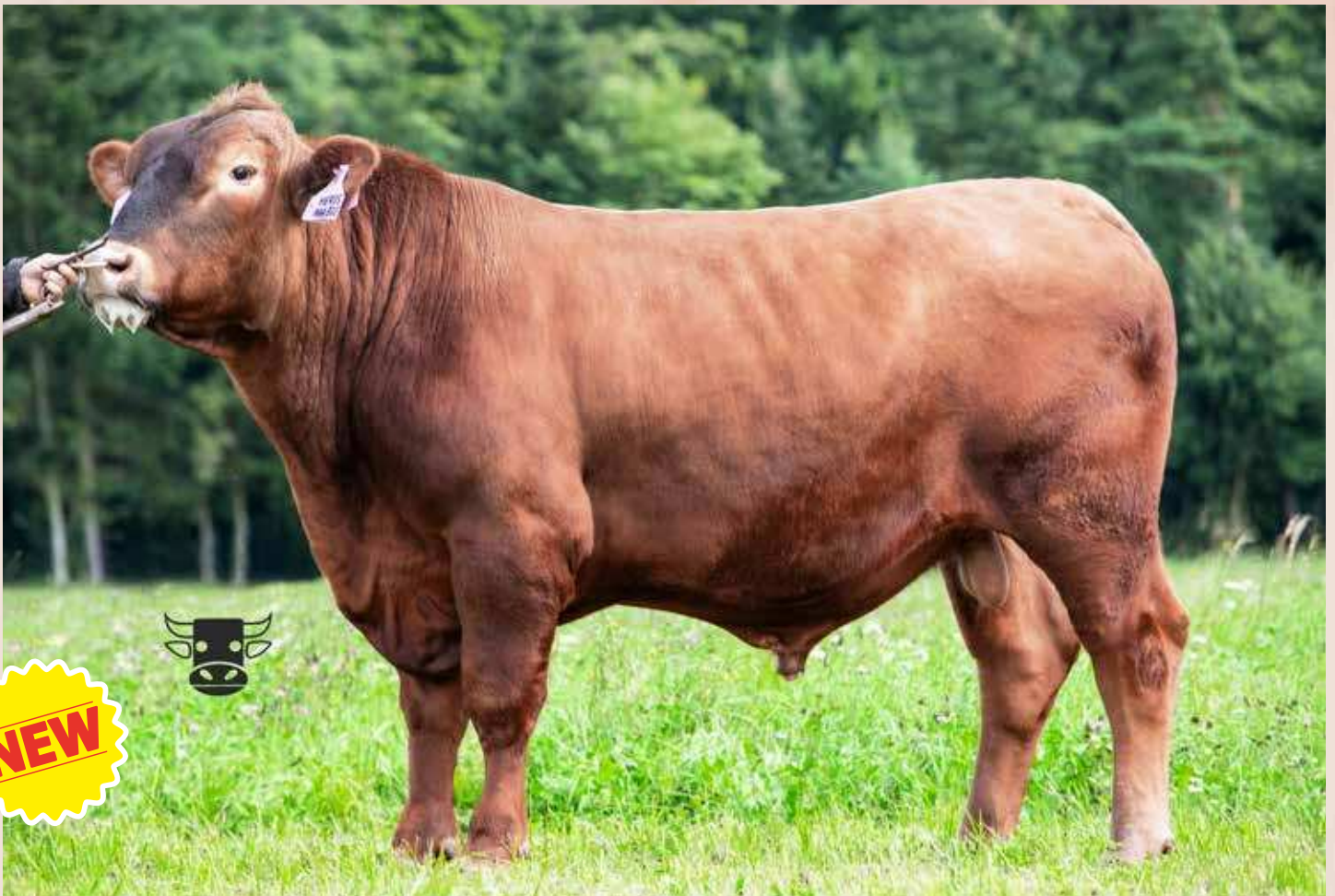
HEROS RED AAA 875

Boston Red z Pěčina ZAI 442 CZ 937962031 Zip Red z Pěčina x CZ336657931 RED Clarisa Red MZLU CZ 259341962 Star Red Tegro x Okrasa Red z Pěčina