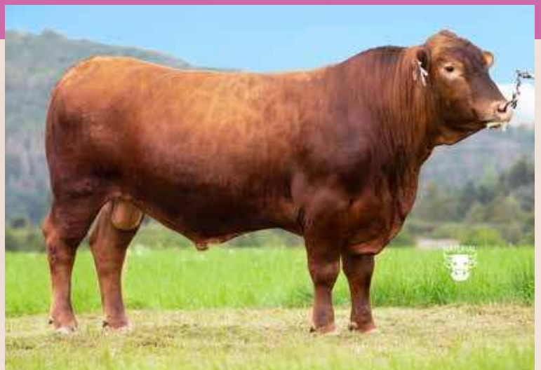
GIM RED AAA 687