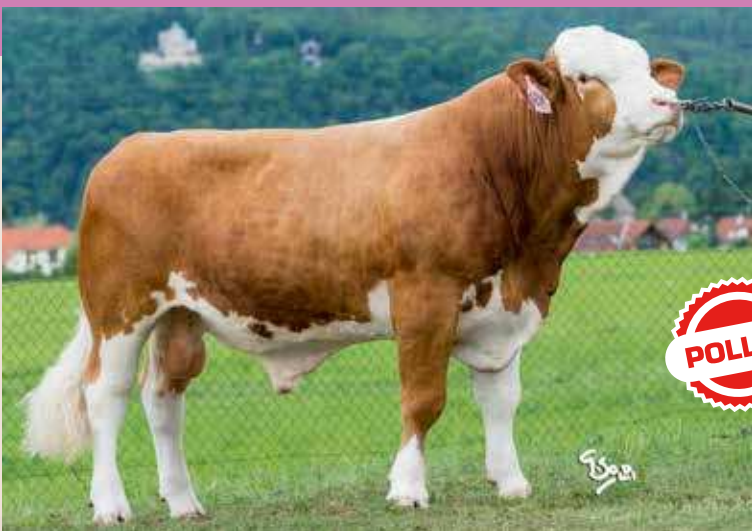
ZIEL P ZMS 315

Curaheen Vio ET R ZSI 949, IE 171059860169 Hillcrest Champion x Raceview Merle-Beauty Ebi Ležnická P CZ 135449941 Vingegaard Colorado P x CZ 109617941 P