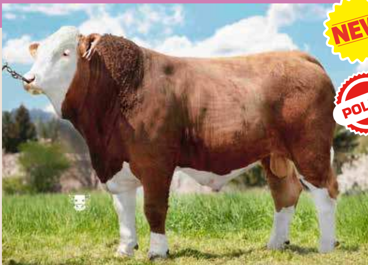
GRÁL P ISM 011

Baron Ležnický PP ZMS 646 CZ 579799041 CZ 721824961 P*