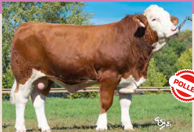
DINO PP ISI 082