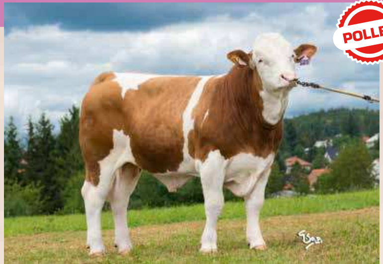
CTIRAD P ZMS 735

Porody / Calving: Na jalovice / For heifers