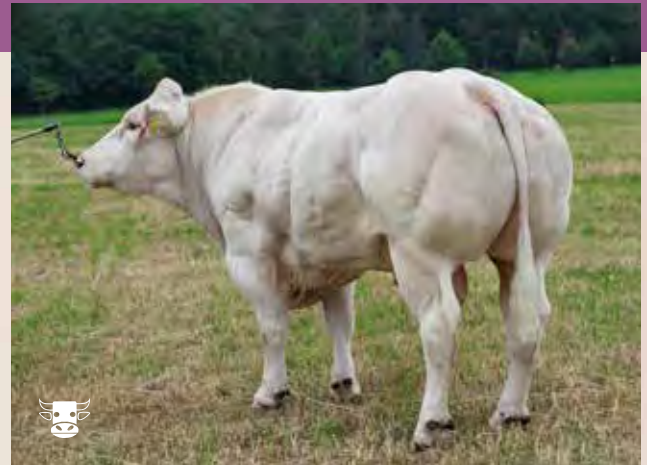
DONNY ZBM 464