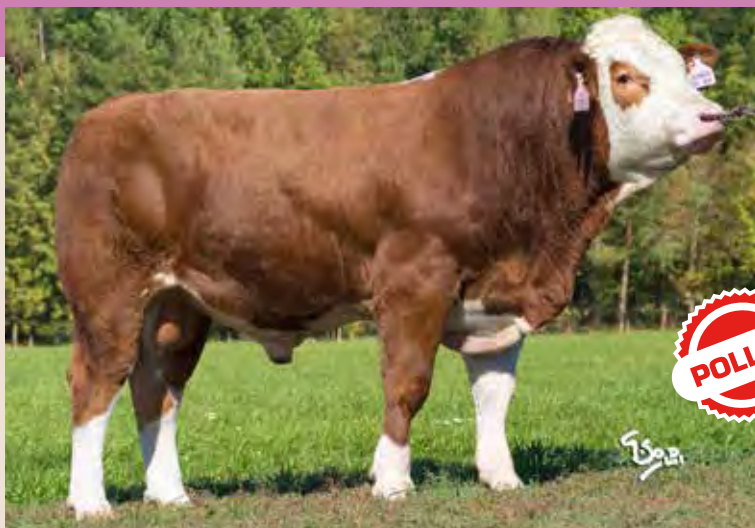
DINGO P ISI 133

Delfur Decider 12 R ZMS 275, UK 523461502995