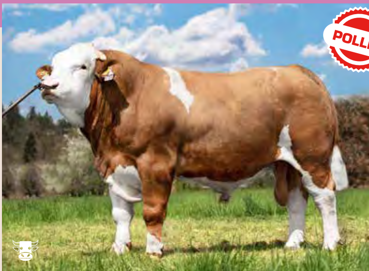
KABOOM P ISI 620

Heterozygously polled Kaboom was purchased in Ireland. He was clearly the most muscular bull we had the opportunity to see. The sire is Sneumgaard Imperator PP, who excels in easy births and excellent calf growth. Mother's father is one of the most popular bull in Ireland – Hillcrest Champion. Kaboom therefore appears to be a complete sire whose muscularity and width parameters are exceptional in all body parts. He will also be suitable for producing daughters, we expect excellent milk production with a well shaped pelvis.