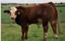
Syn Dinga P