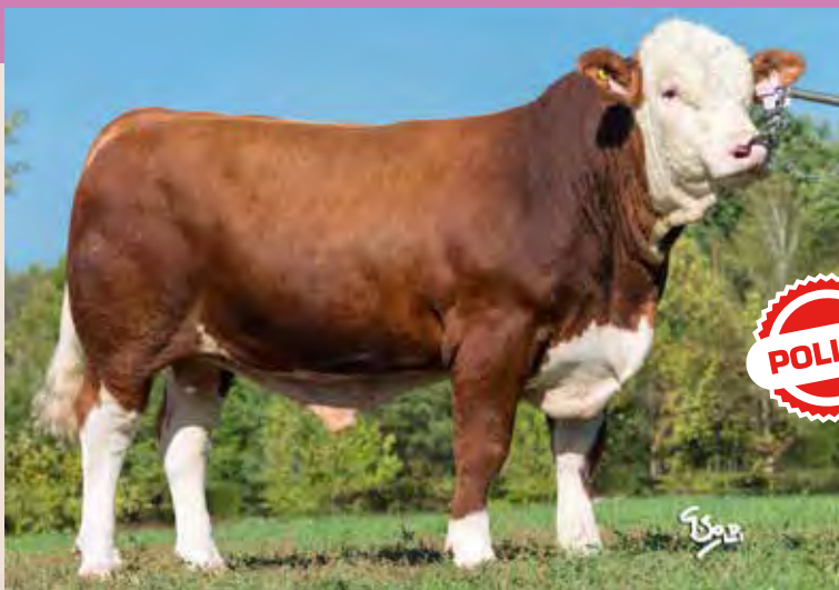
DUBLER V ISI 023

Vingegaard Iron PP ZMS 281 DK 4152401469