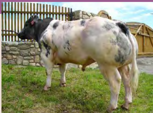
LORD ZBM 220