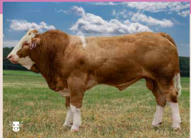
GIF V ISI 768