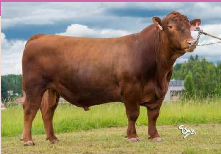
ABSOLUTE RED ZAI 242