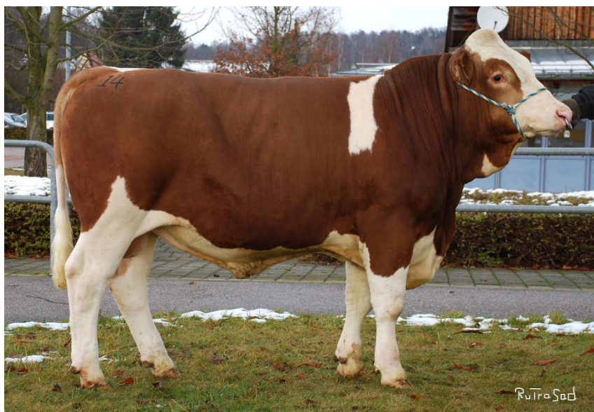
Korn BCH 130

Matka: (Damara) 3. 305 11551 4,58 529 3,45 399