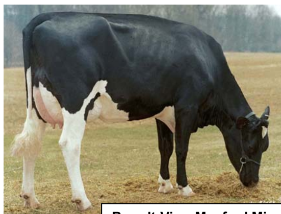
Brandt-View Manfred Miss VG 88