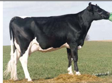
Da-Net Patron Pansy VG 87