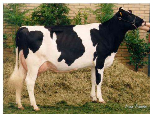
MMMM : Grietje 80 EX 90