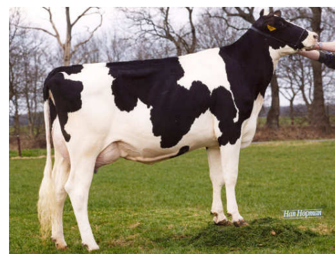
MMM : Genua VG 87