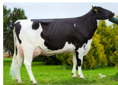
Matka: Ostretin Genua 2 G+84