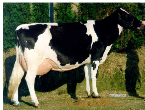
MMMM : Grietje 79 VG 89