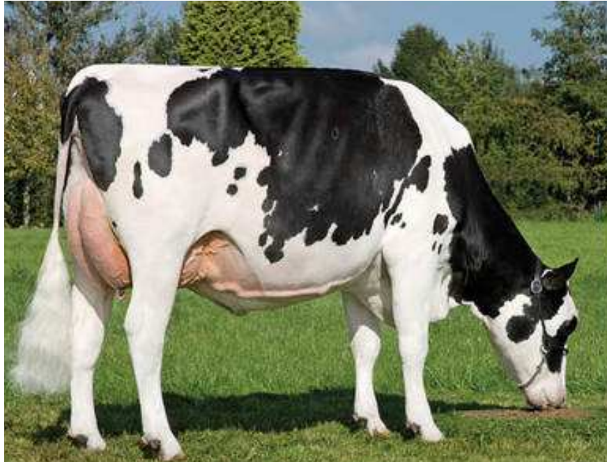
Matka: Snowpolly RC P VG 85