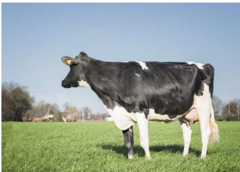
Matka Wilder Hira VG 85

Elitní vnuk americké špičky na dcerách Saloona Otec býků