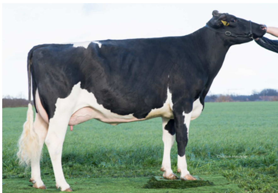
Matka: Wilder Kavola VG 87