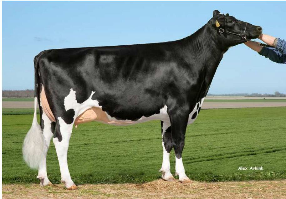
MM: Twin Sheray 2 VG-85

Stejná rodina jako Maxim, Esquire, Ellrod..