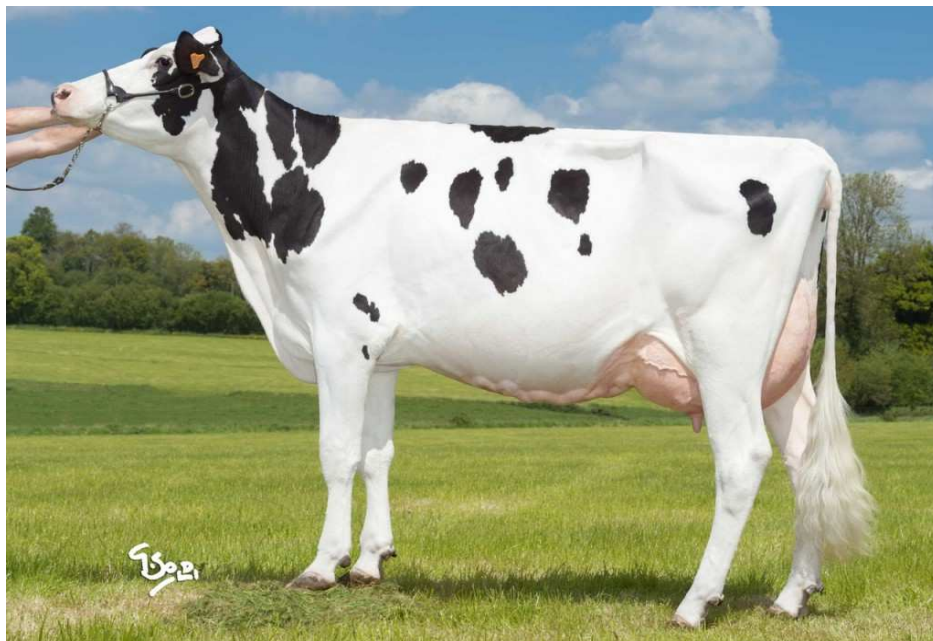
Matka matky matky býka Ferm: Fily Sher VG-86