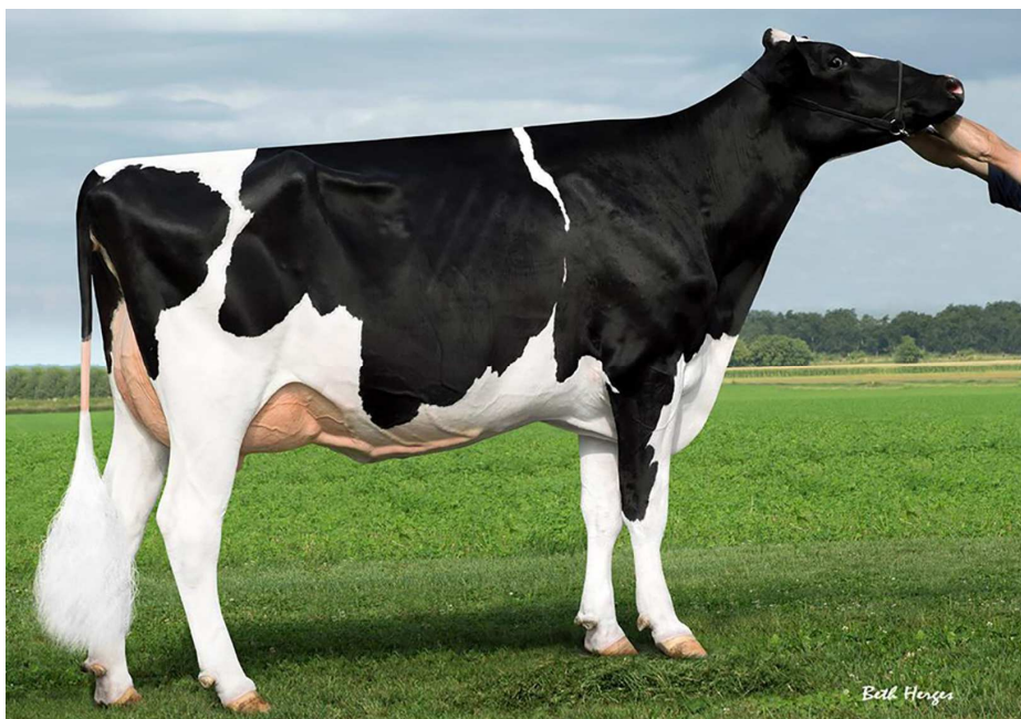
Matka: Lacreast Canto VG 88

Stejná rodina jako DG Charley A2A2 beta kasein