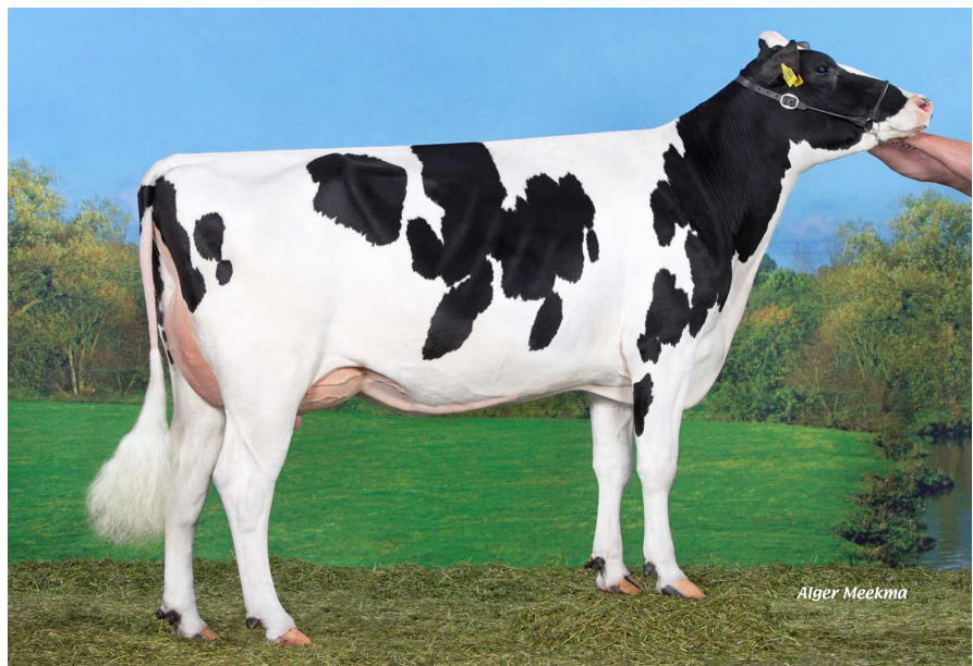
Matka: RZN Shila G+83