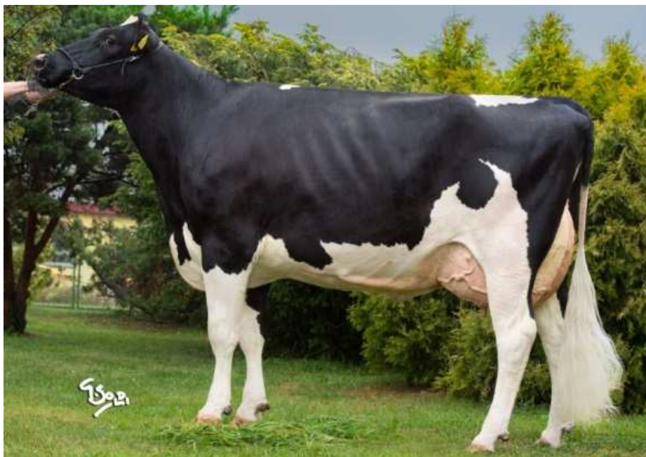
Matka: Ostretin Genua 26 VG 86

Z rodiny Genua s vynikajícím obsahem mléčných složek s prověřenými matkami v domácích podmínkách